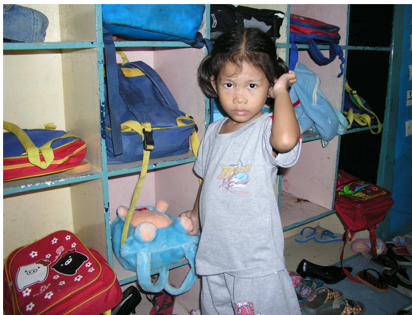
Die Kinder erhalten im Fountain of Life Zentrum Schutz und eine ihren Fähigkeiten und ihrem Alter entsprechende Ausbildung.